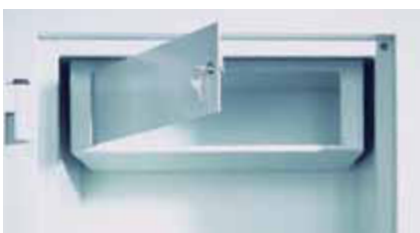
Innenfach mit Zylinderschloss

* Durch die vorstehenden Beschläge erhöht sich das Außenmaß in der Tiefe um 80 mm.