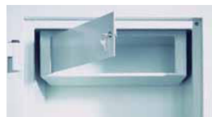
Separat verschließbares Innenfach (Sonderausstattung)