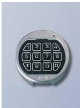
Elektronisches ZKS La Gard Basic