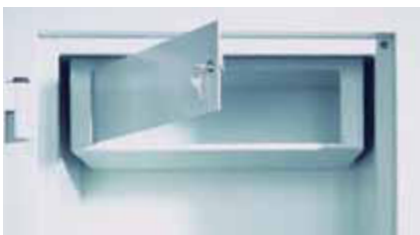
Innenfach mit Zylinderschloss (Sonderausstattung)

* Durch die vorstehenden Beschläge erhöht sich das Außenmaß in der Tiefe um 80 mm.