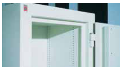
Rasteraufteilung des Innenraums