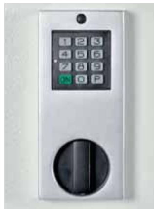
Elektronisches Tastenkombinationsschloss Code-Combi-B