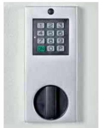
Elektronisches Tastenkombinationsschloss Code-Combi-B