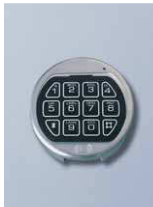
Elektronisches ZKS La Gard Basic