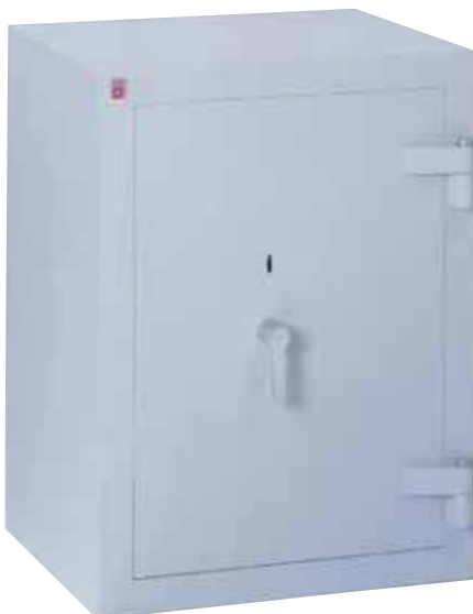
Mehrwandiger Tresoraufbau, massive Riegelbolzen

Sie möchten unterschiedliche Farben für innen und außen? Fragen Sie uns!