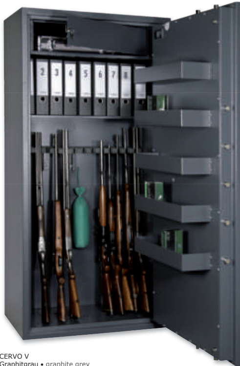
CERVO V Graphitgrau • graphite grey Dekoration nicht im Lieferumfang enthalten • decoration not included in the delivery

Waffenschrank, Grad I (EN 1143-1) Weapon safe, Grade I (EN 1143-1)