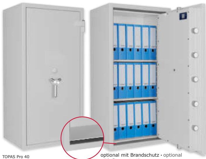
TOPAS Pro 40 Lichtgrau • light grey optional mit Brandschutz • optional with fire protection

Dekoration nicht im Lieferumfang enthalten • decoration not included in the delivery