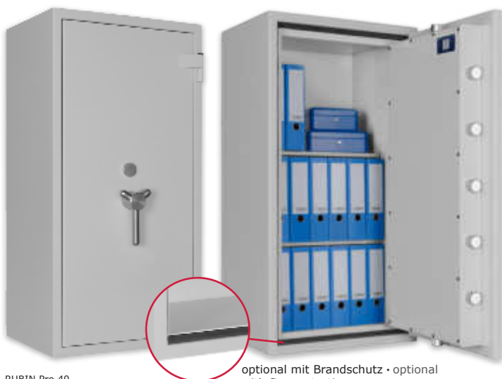
RUBIN Pro 40 Lichtgrau • light grey optional mit Brandschutz • optional with fire protection Dekoration nicht im Lieferumfang enthalten • decoration not included in the delivery