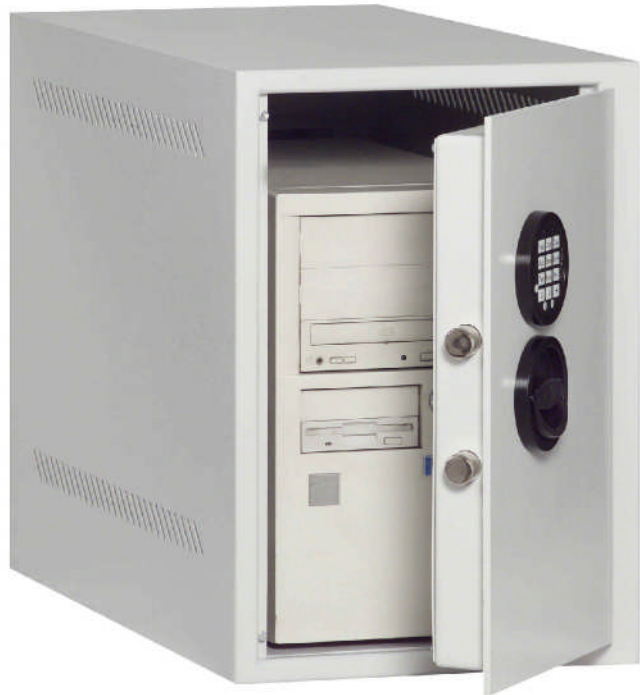
Art.-Nr.61500 mit 61521