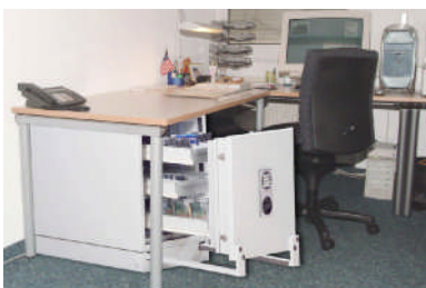
Art. 46500 passt unter fast jeden Schreibtisch der die richtige Höhe hat