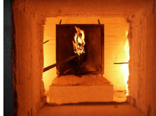
Abb. 2 Tresor wird beflammt 1 Stunde bis 1090°