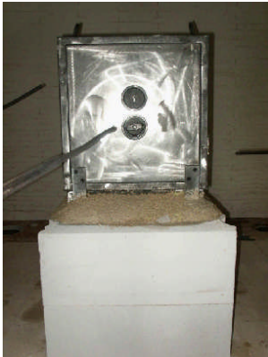
Abb. 1 kommt in Ofen