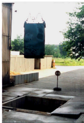
Abb. 5 nach Feuer- u. Sturzttest aus 9,15 m Höhe (Innenraum ist unversehrt)