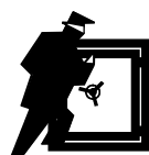
Klasse I EN 1143-1

bei Außentiefe 755mm: 75x347x516mm (HxBxT)