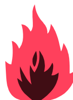
S 60 DIS EN 1047-1

S60DIS = 60 Min. zertifizierter Feuerschutz für Daten durch besondere Betonfüllstoffe und spezielle Dichtungen. Erfolgreicher Feuerwiderstands- sowie Feuerstoßtest bis 1090°C und Sturzttest aus 9,15m Fallhöhe. Nähere Details siehe Seite 107-A.