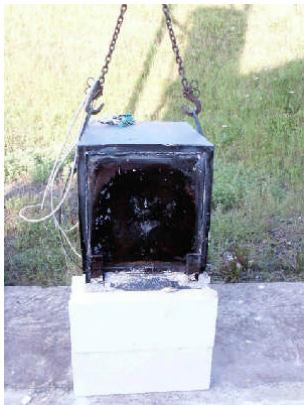
Abb. 4 vor Sturzttest