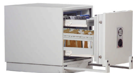
Abb. mit Hängeregister darüber Schublade mit CD-ROM