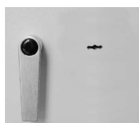
Hängegriff DB Metall standard