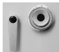
Art. Nr.: 38020