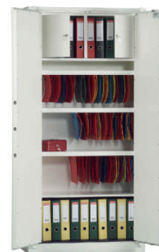
Art.38004 mit 3x 38024 + 38029 gg. Aufpreis