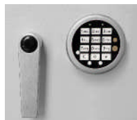
Art. Nr.: 38021 + Art. Nr.: 38022