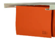
Art. 38024 (unter FB recht+links einhängbar)