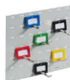
neues Hakensystem in unterschiedlichen Längen