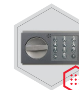
Elektronisches Kombinationsschloss (außer Art. 18000-18001)